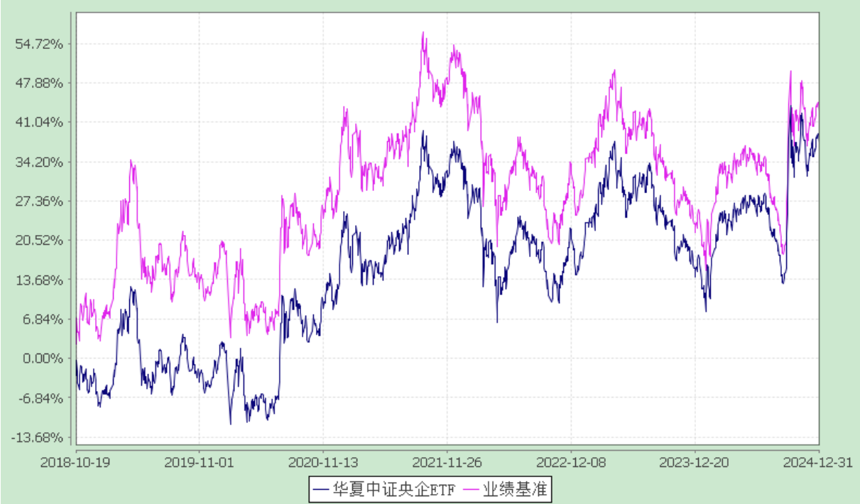
华夏中证央企结构调整交易型开放式指数证券投资基金 过去五年基金净值增长率与业绩比较基准收益率的对比图