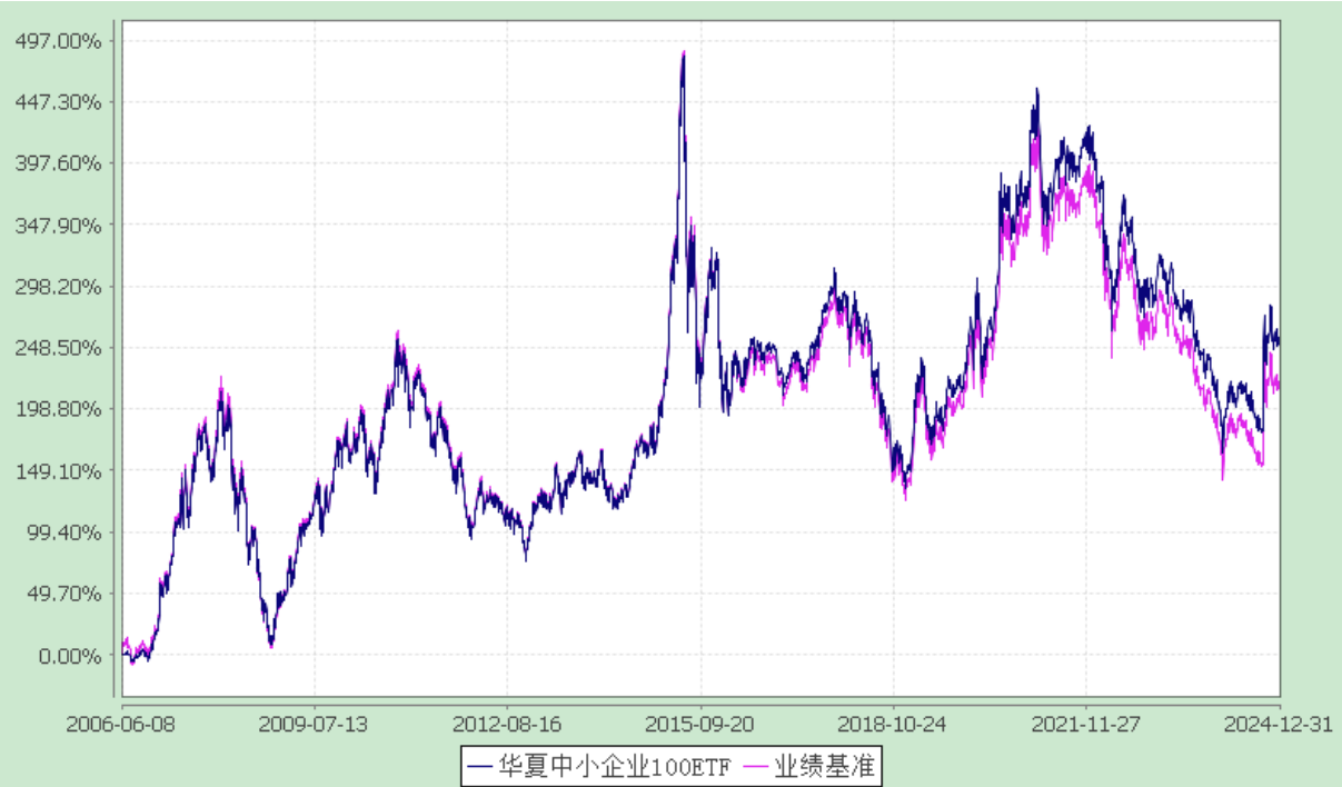
份额累计净值增长率与业绩比较基准收益率历史走势对比图 (2006 年 6 月 8 日至 2024 年 12 月 31 日)