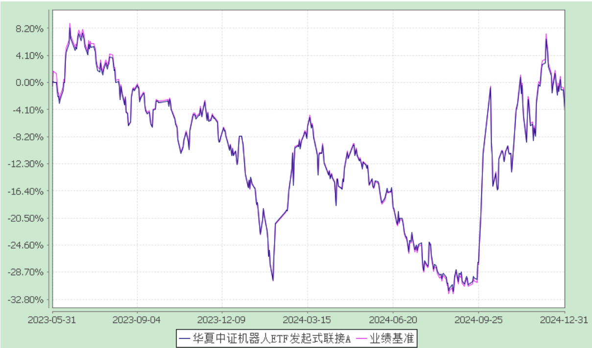
华夏中证机器人交易型开放式指数证券投资基金发起式联接基金 份额累计净值增长率与业绩比较基准收益率历史走势对比图 (2023 年 5 月 31 日至 2024 年 12 月 31 日)

3.2.2 自基金合同生效以来基金份额累计净值增长率变动及其与同期业绩比较基准收益率变动的比较