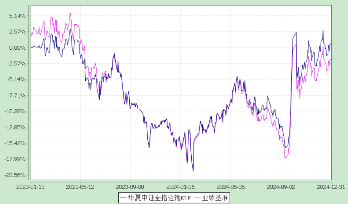
华夏中证全指运输交易型开放式指数证券投资基金 份额累计净值增长率与业绩比较基准收益率历史走势对比图 (2023 年 1 月 13 日至 2024 年 12 月 31 日)

3.2.3 自基金合同生效以来基金每年净值增长率及其与同期业绩比较基准收益率的比较