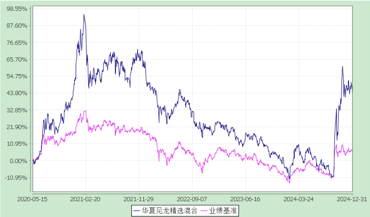
华夏见龙精选混合型证券投资基金 份额累计净值增长率与业绩比较基准收益率历史走势对比图 (2020 年 5 月 15 日至 2024 年 12 月 31 日)