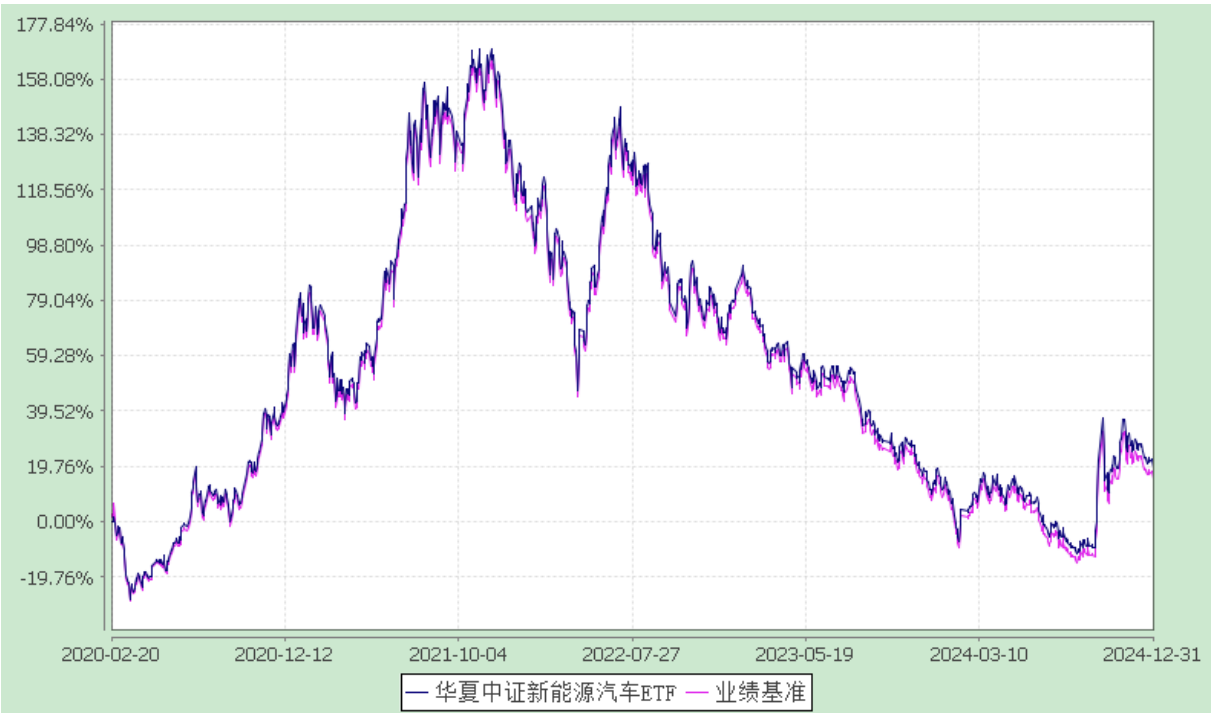
华夏中证新能源汽车交易型开放式指数证券投资基金 自基金合同生效以来基金净值增长率与业绩比较基准收益率的对比图