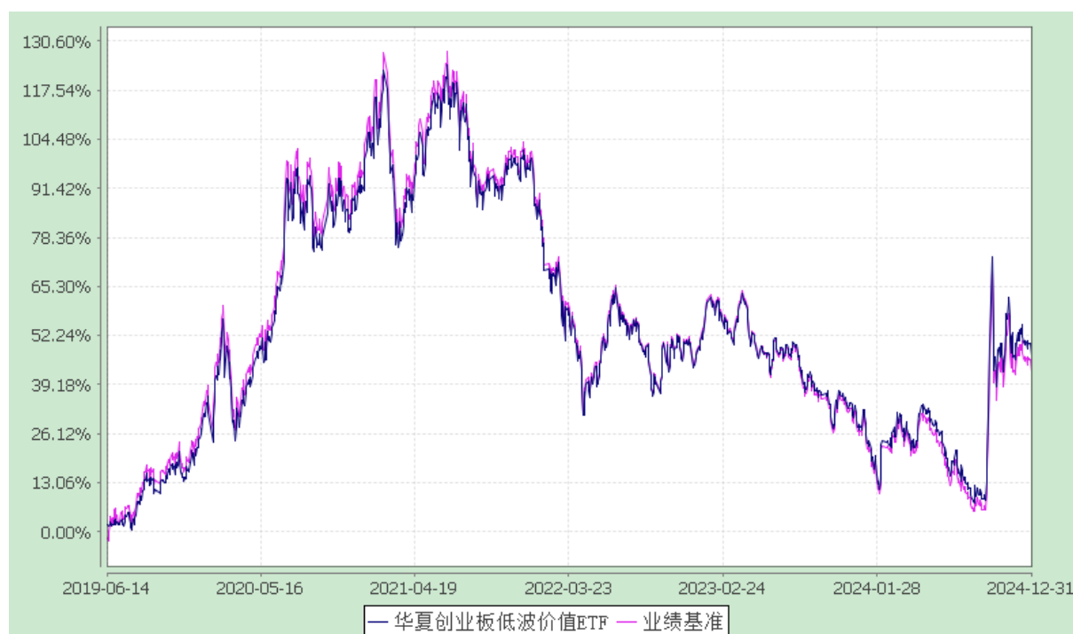
华夏创业板低波价值交易型开放式指数证券投资基金 份额累计净值增长率与业绩比较基准收益率历史走势对比图 (2019 年 6 月 14 日至 2024 年 12 月 31 日)