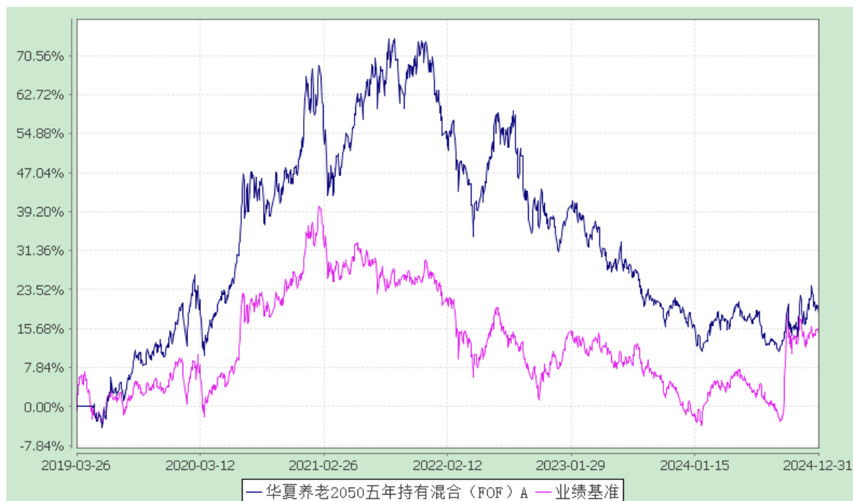
华夏养老 2050 五年持有混合（FOF）Y