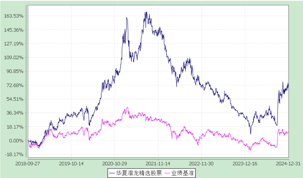
份额累计净值增长率与业绩比较基准收益率历史走势对比图 (2018 年 9 月 27 日至 2024 年 12 月 31 日)