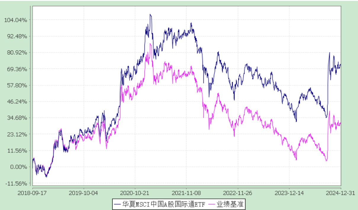
华夏 MSCI 中国 A 股国际通交易型开放式指数证券投资基金 份额累计净值增长率与业绩比较基准收益率历史走势对比图 (2018 年 9 月 17 日至 2024 年 12 月 31 日)

注：本基金自 2018 年 9 月 17 日起由"MSCI 中国 A 股交易型开放式指数证券投资基金"转型而来。