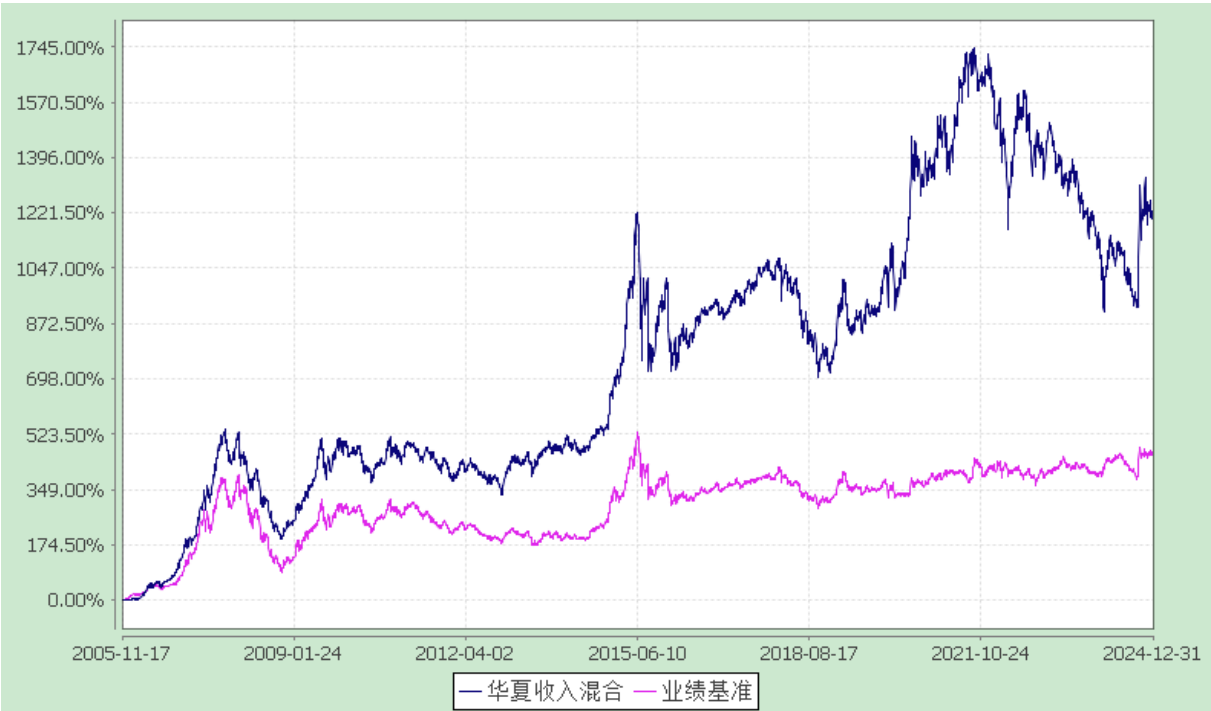
华夏收入混合型证券投资基金 份额累计净值增长率与业绩比较基准收益率历史走势对比图 (2005 年 11 月 17 日至 2024 年 12 月 31 日)