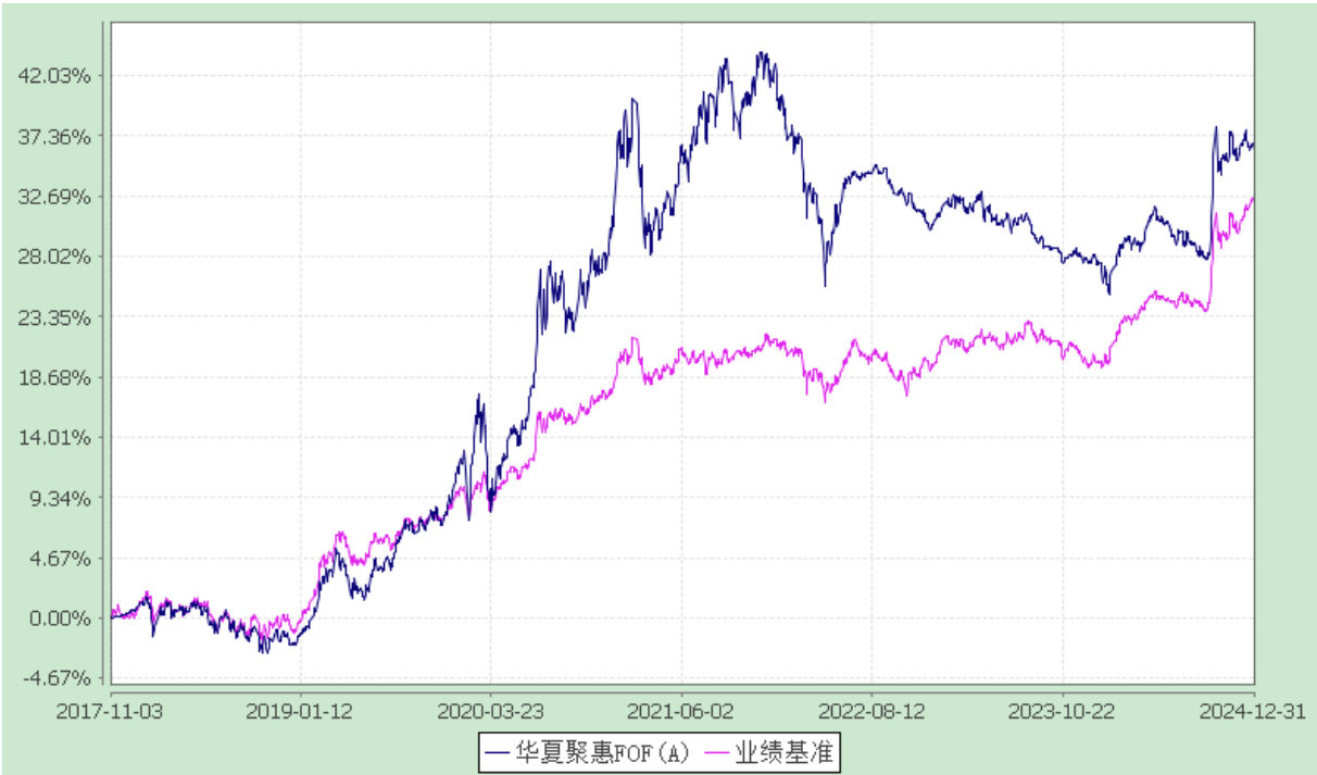
份额累计净值增长率与业绩比较基准收益率历史走势对比图 (2017 年 11 月 3 日至 2024 年 12 月 31 日)

3.2.2 自基金合同生效以来基金份额累计净值增长率变动及其与同期业绩比较基准收益率变动的比较