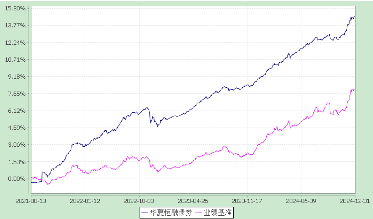
份额累计净值增长率与业绩比较基准收益率历史走势对比图 (2021 年 8 月 18 日至 2024 年 12 月 31 日)

注：本基金自 2021 年 8 月 18 日起由"华夏恒融一年定期开放债券型证券投资基金"转型而来。