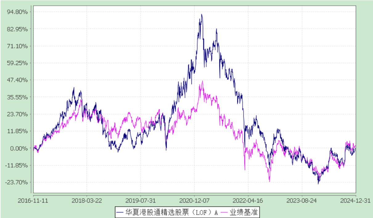
华夏港股通精选股票 C