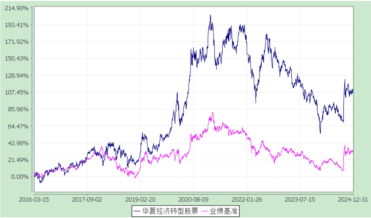
份额累计净值增长率与业绩比较基准收益率历史走势对比图 (2016 年 3 月 15 日至 2024 年 12 月 31 日)