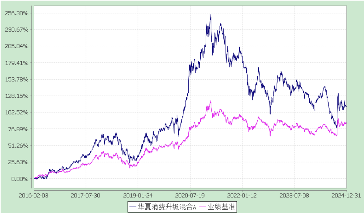
份额累计净值增长率与业绩比较基准收益率历史走势对比图 (2016 年 2 月 3 日至 2024 年 12 月 31 日)

3.2.2 自基金合同生效以来基金份额累计净值增长率变动及其与同期业绩比较基准收益率变动的比较