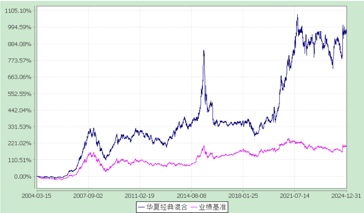
份额累计净值增长率与业绩比较基准收益率历史走势对比图 (2004 年 3 月 15 日至 2024 年 12 月 31 日)