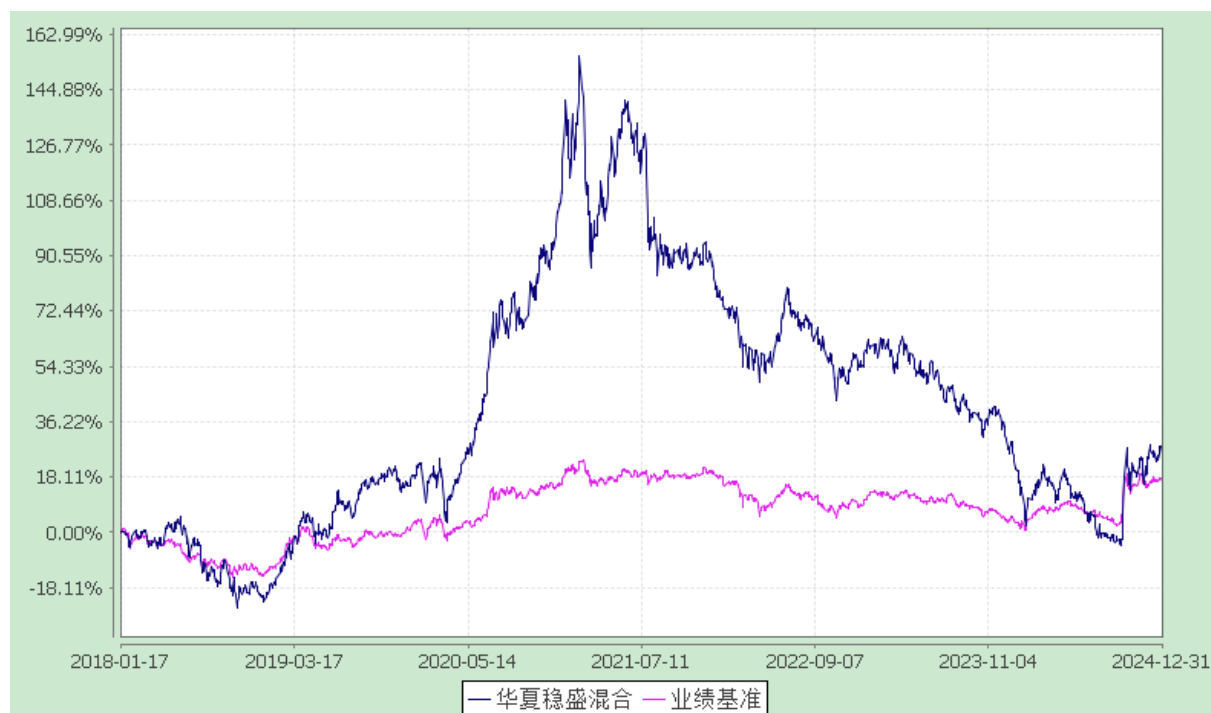
华夏稳盛灵活配置混合型证券投资基金 份额累计净值增长率与业绩比较基准收益率历史走势对比图 (2018 年 1 月 17 日至 2024 年 12 月 31 日)