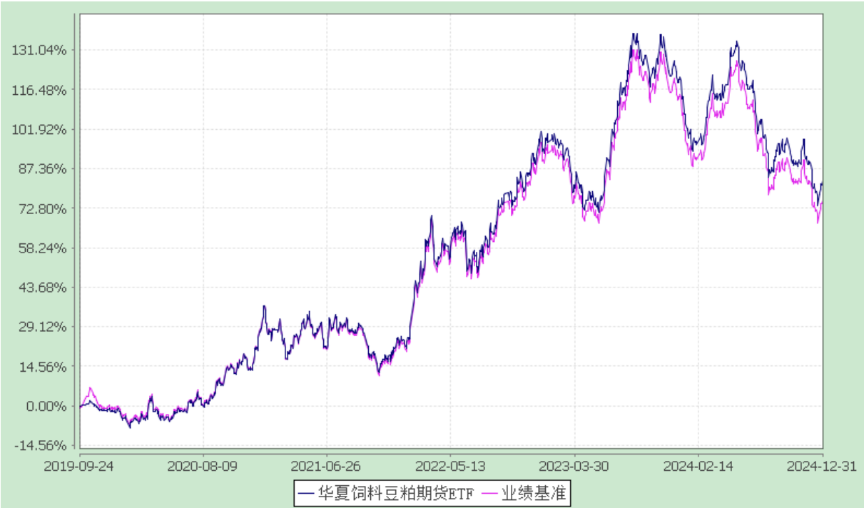
份额累计净值增长率与业绩比较基准收益率历史走势对比图 (2019 年 9 月 24 日至 2024 年 12 月 31 日)