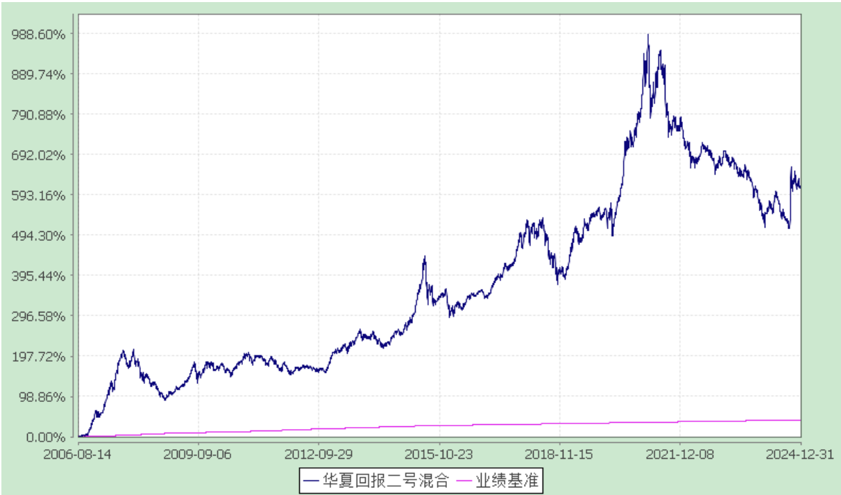
华夏回报二号证券投资基金 过去五年基金净值增长率与业绩比较基准收益率的对比图