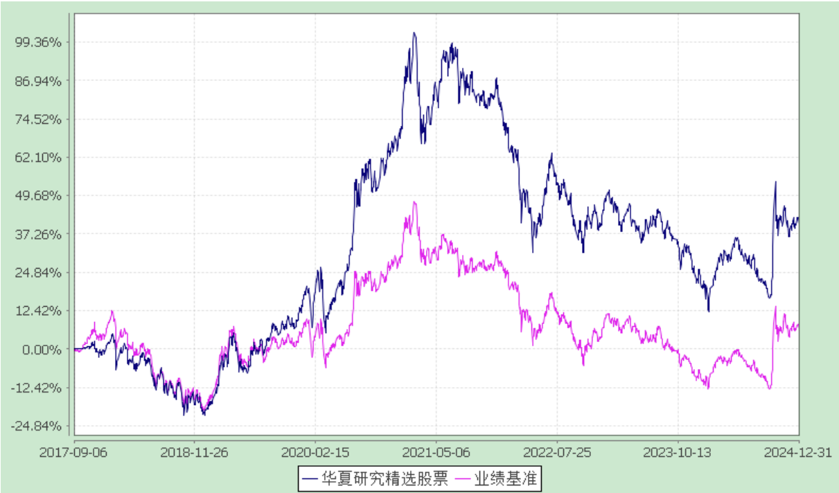
份额累计净值增长率与业绩比较基准收益率历史走势对比图 (2017 年 9 月 6 日至 2024 年 12 月 31 日)