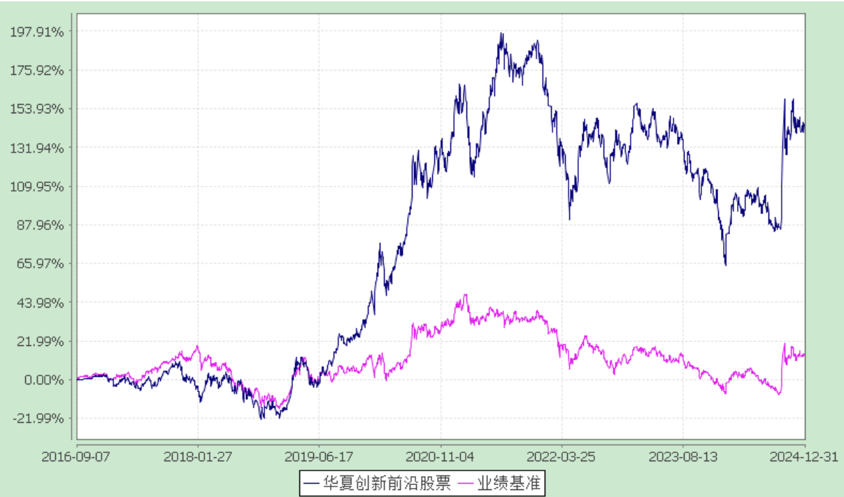
份额累计净值增长率与业绩比较基准收益率历史走势对比图 (2016 年 9 月 7 日至 2024 年 12 月 31 日)