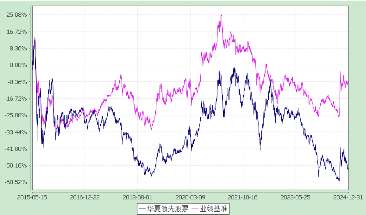
华夏领先股票型证券投资基金 过去五年基金净值增长率与业绩比较基准收益率的对比图