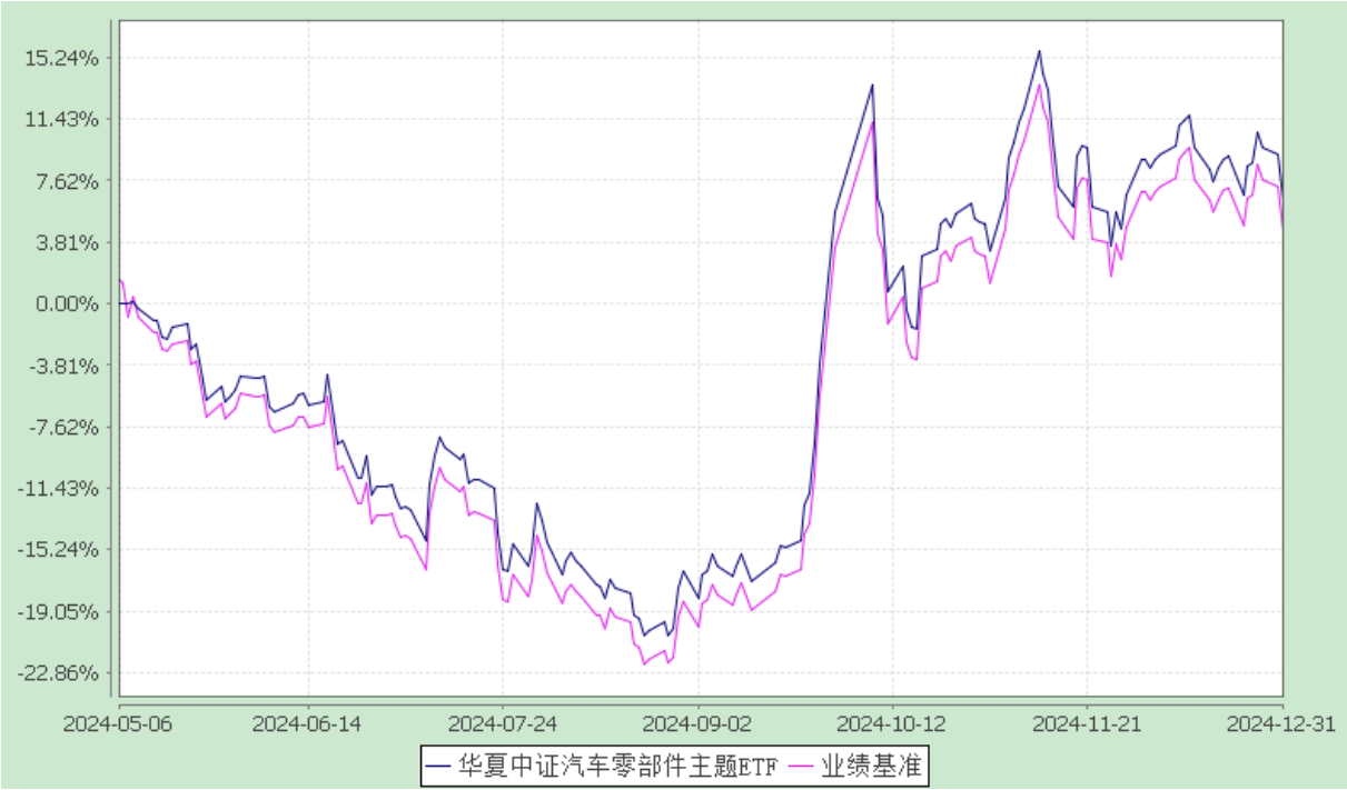
华夏中证汽车零部件主题交易型开放式指数证券投资基金 份额累计净值增长率与业绩比较基准收益率历史走势对比图 (2024 年 5 月 6 日至 2024 年 12 月 31 日)

注：①本基金合同于 2024 年 5 月 6 日生效。 ②根据本基金的基金合同规定，本基金自基金合同生效之日起 6 个月内使基金的投资组合比例符合本基金合同中投资范围、投资限制的有关约定。