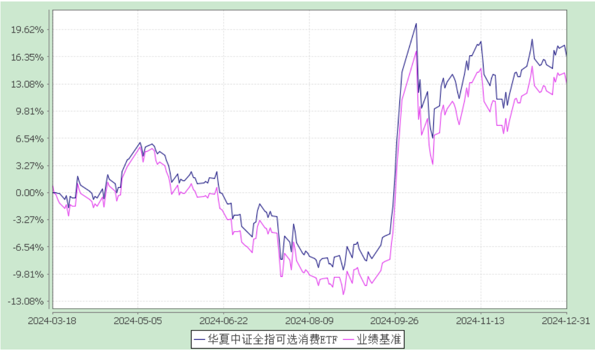
华夏中证全指可选消费交易型开放式指数证券投资基金 份额累计净值增长率与业绩比较基准收益率历史走势对比图 (2024 年 3 月 18 日至 2024 年 12 月 31 日)

注：①本基金合同于 2024 年 3 月 18 日生效。 ②根据本基金的基金合同规定，本基金自基金合同生效之日起 6 个月内使基金的投资组合比例符合本基金合同中投资范围、投资限制的有关约定。