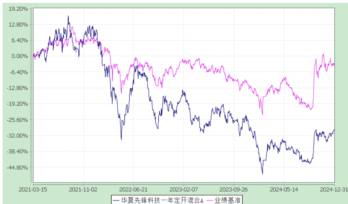
华夏先锋科技一年定开混合 C