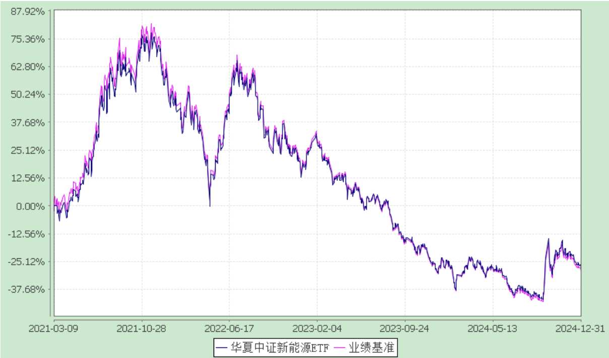
华夏中证新能源交易型开放式指数证券投资基金 份额累计净值增长率与业绩比较基准收益率历史走势对比图 (2021 年 3 月 9 日至 2024 年 12 月 31 日)