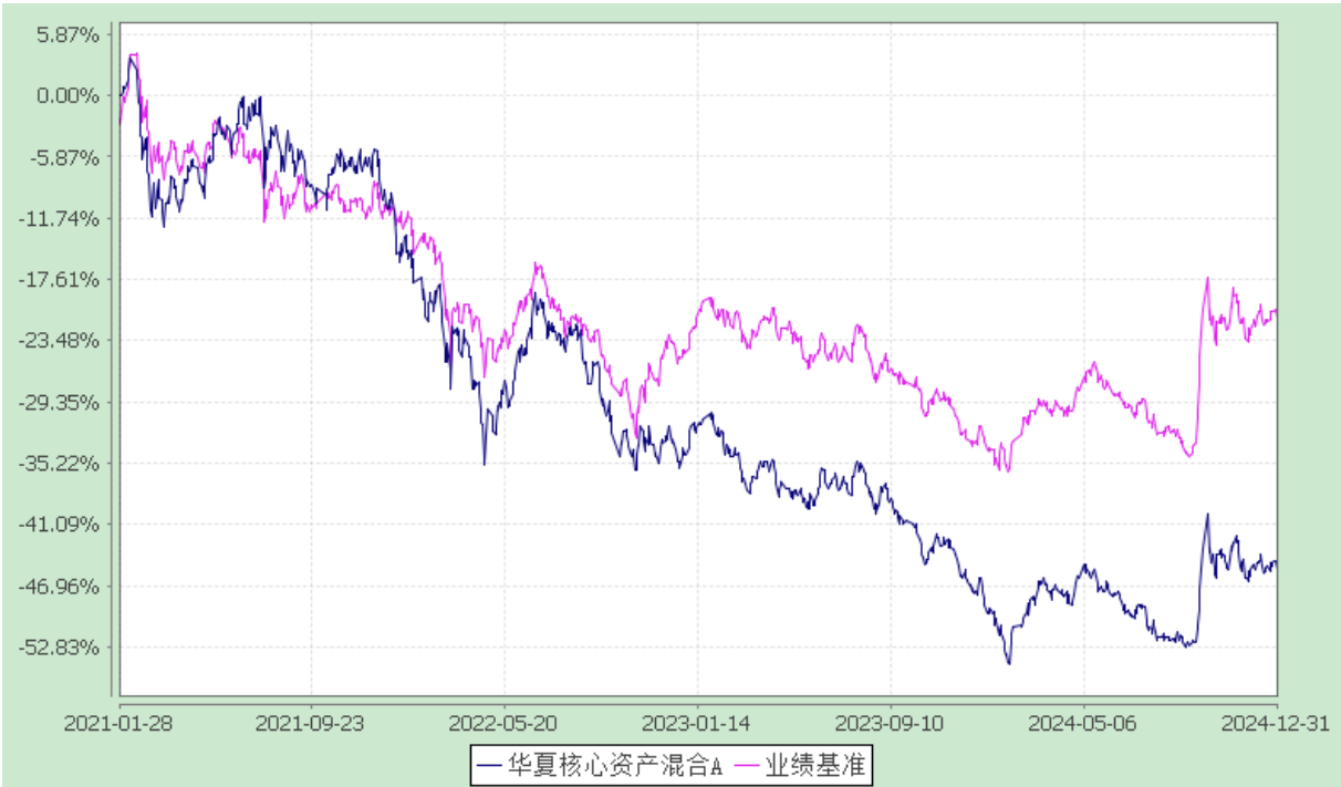
份额累计净值增长率与业绩比较基准收益率历史走势对比图 (2021 年 1 月 28 日至 2024 年 12 月 31 日)

3.2.2 自基金合同生效以来基金份额累计净值增长率变动及其与同期业绩比较基准收益率变动的比较