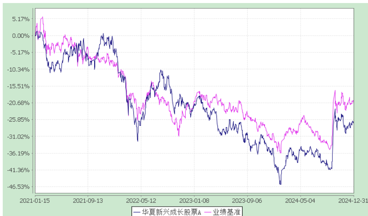
华夏新兴成长股票 C