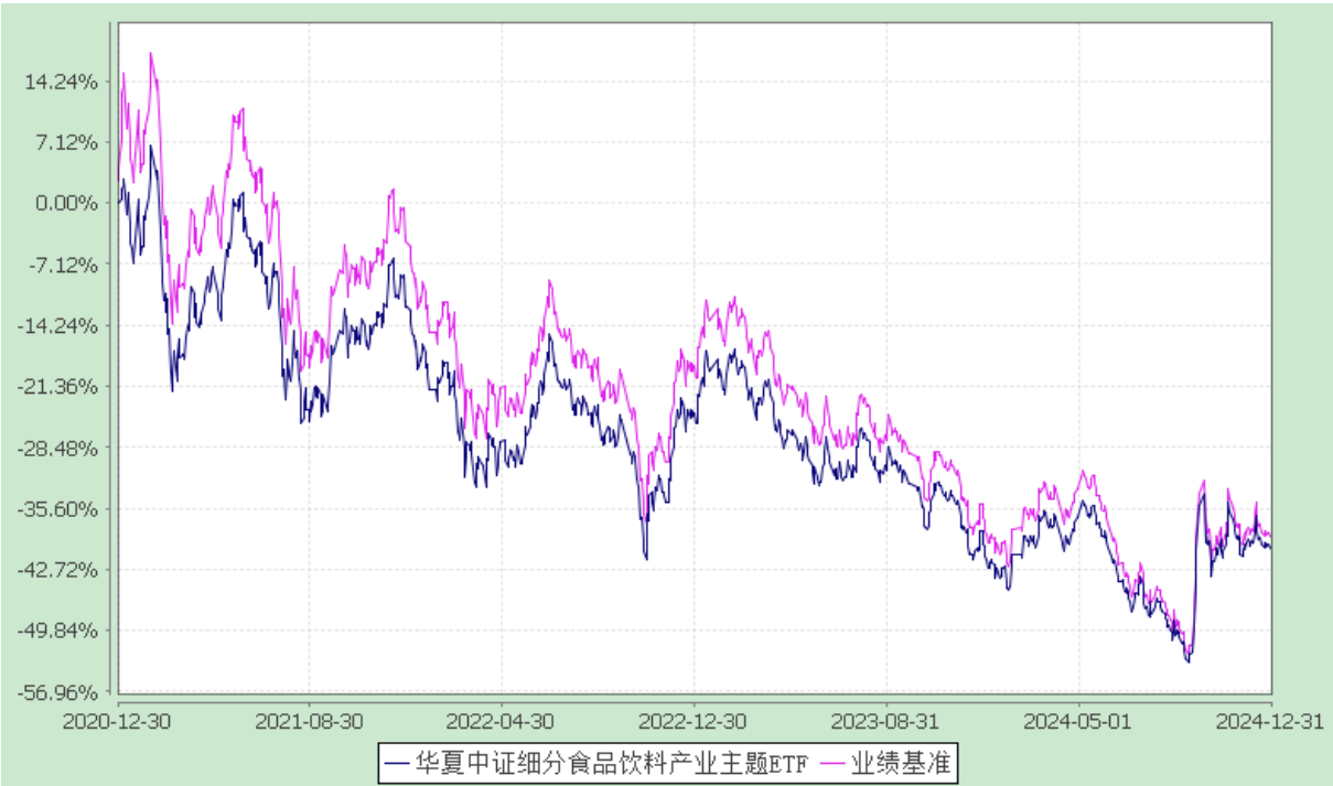
华夏中证细分食品饮料产业主题交易型开放式指数证券投资基金 自基金合同生效以来基金净值增长率与业绩比较基准收益率的对比图