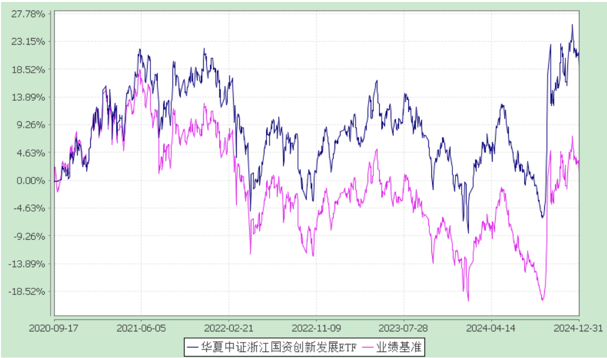
华夏中证浙江国资创新发展交易型开放式指数证券投资基金 自基金合同生效以来基金净值增长率与业绩比较基准收益率的对比图