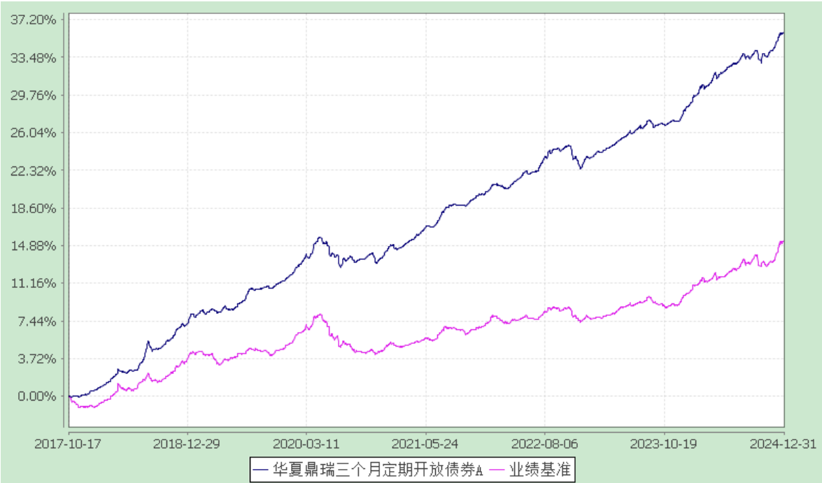
华夏鼎瑞三个月定期开放债券型发起式证券投资基金 累计净值增长率与业绩比较基准收益率的历史走势对比图 (2017 年 10 月 17 日至 2024 年 12 月 31 日)

注：2017 年 10 月 17 日至 2020 年 11 月 16 日期间，华夏鼎瑞三个月定期开放债券 C 类基金份额为零。