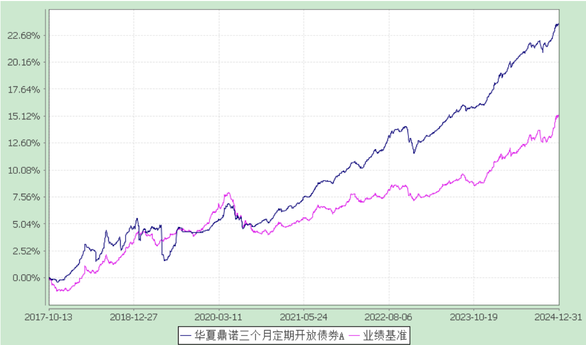
华夏鼎诺三个月定期开放债券型发起式证券投资基金 累计净值增长率与业绩比较基准收益率的历史走势对比图 (2017 年 10 月 13 日至 2024 年 12 月 31 日)

注：2017 年 10 月 13 日至 2020 年 11 月 16 日期间，华夏鼎诺三个月定期开放债券 C 类基金份额为零。