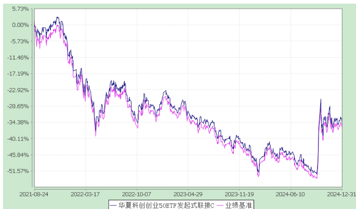
华夏科创创业 50ETF 发起式联接 Y: