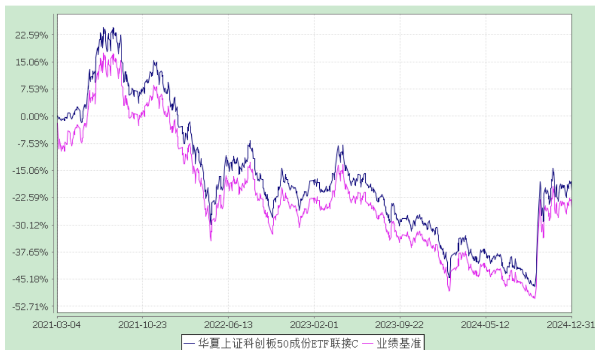
华夏上证科创板 50 成份 ETF 联接 Y: