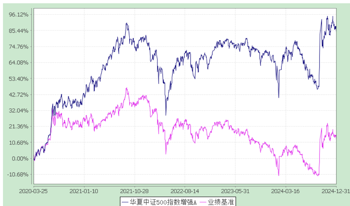
华夏中证 500 指数增强 C: