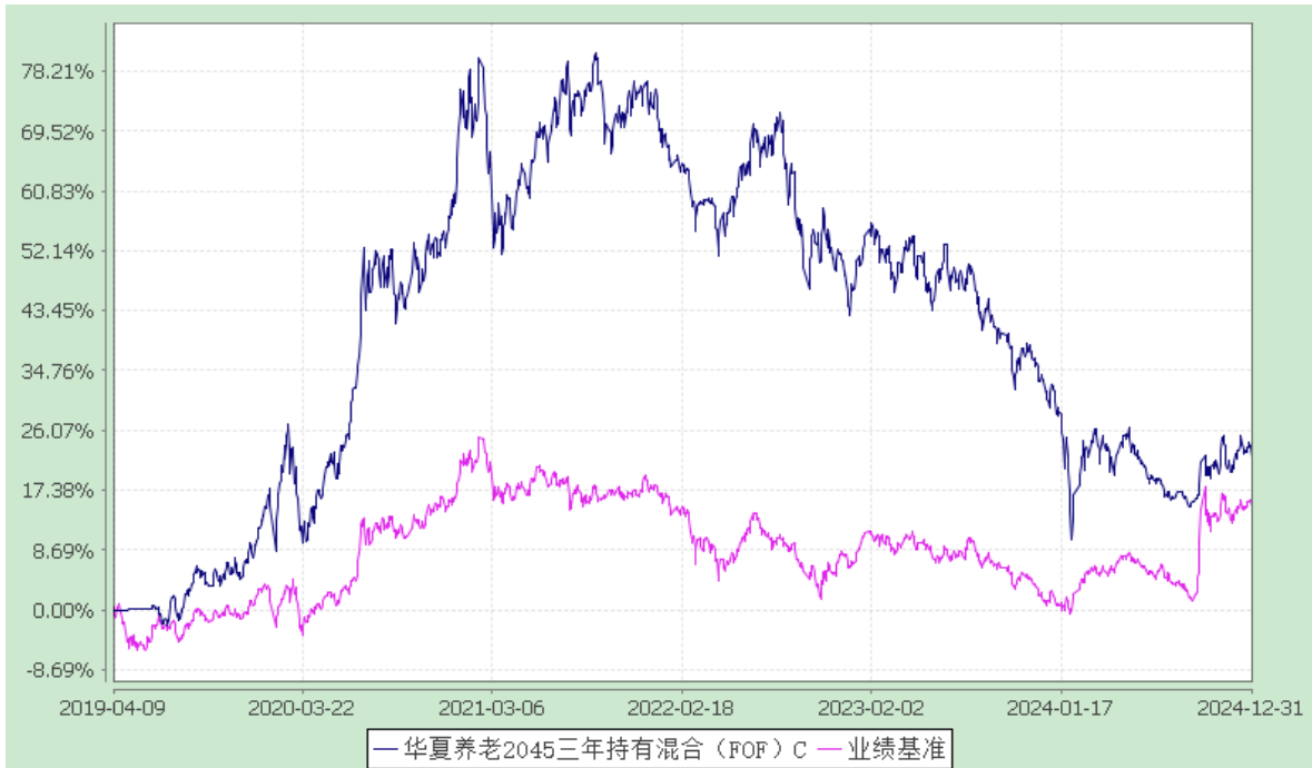
华夏养老 2045 三年持有混合（FOF）Y：